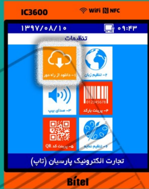
۴- گزینه ۱- دانلود از راه دور را انتخاب کنید