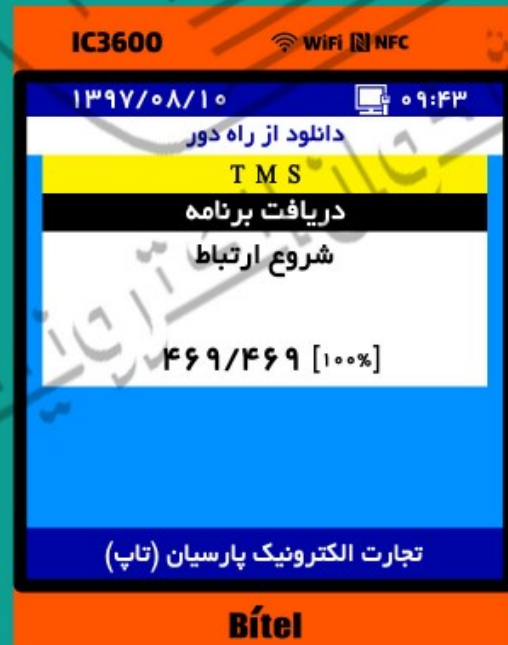
۶- دستگاه در حال دریافت برنامه می باشد