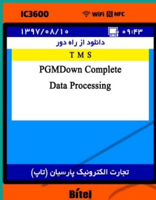
۷- دریافت برنامه انجام شد