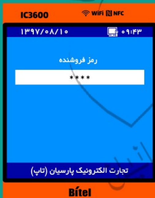
۹- رمز فروشنده ۰۰۰۰ را وارد کنید