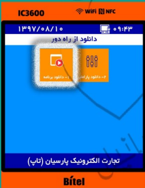
۵- گزینه ۱- دانلود برنامه را انتخاب کنید