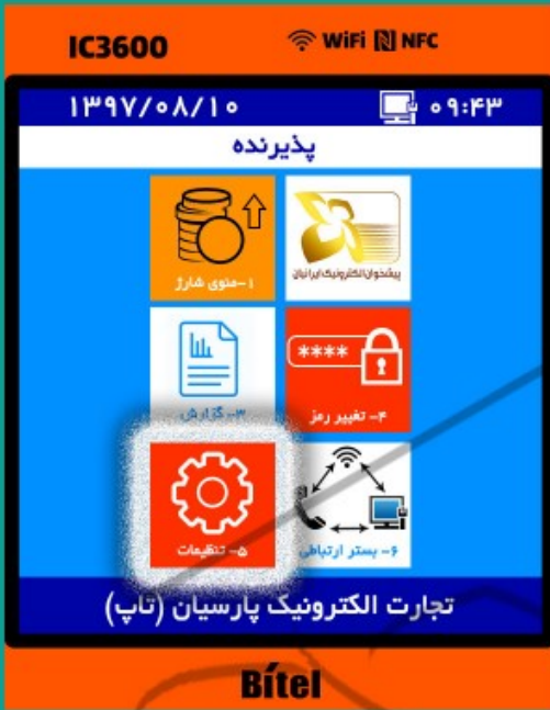
۳- گزینه ۵- تنظیمات را انتخاب کنید