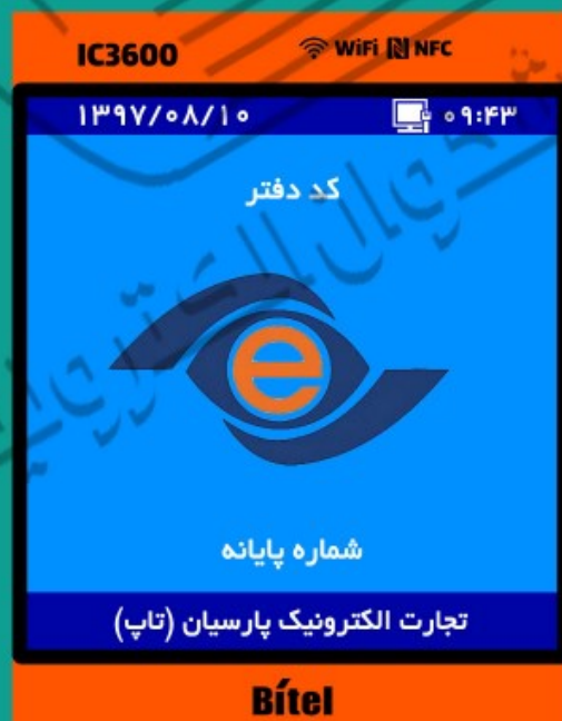
۱۰- کد دفتر و شماره پایانه نمایش داده می شود